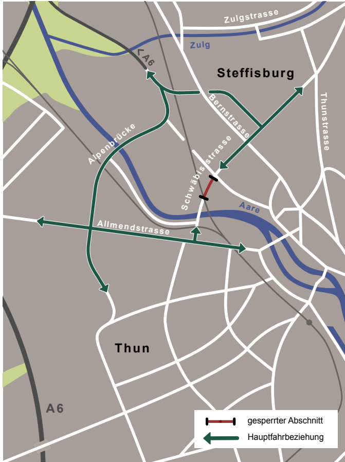
Umleitung Durchgangsverkehr vom 4. März bis Oktober 2024